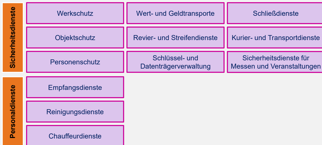
ABBILDUNG 2: DIENSTLEISTUNGEN VON SDM